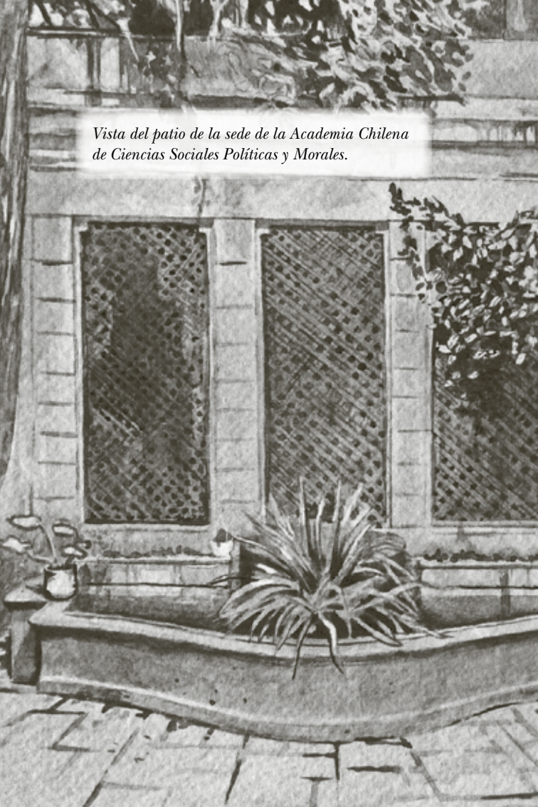
Vista del patio de la sede de la Academia Chilena de Ciencias Sociales Políticas y Morales.