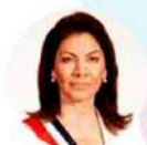
Laura Chinchilla Costa Rica

Academic Director of the World Law Congress. Professor at the Universidad Complutense de Madrid. Judge Emeritus of the Constitutional Court. Member of the Spanish Royal Academy of Jurisprudence and Legislation